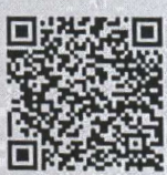
รายละเอียดการส่งผลงานวิจัย

สำนักวิจัยและพัฒนาการศึกษา โทร. ๐-๒๖๖๘-๗๑๒๓ ต่อ ๑๓๓๐ ๑๓๑๕ และ ๑๓๑๓ โทรสาร ๐-๒๒๔๓-๒๗๗๐