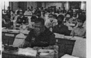
ข่าว/ภาพข่าว : งานจัดการแหล่งทุนบริการวิชาการ

กองส่งเสริมการบริการวิชาการ ม.นครสวรรค์ ร่วมประชุม คณะกรรมการบริหารงานจังหวัดแบบบูรณาการ (ก.บ.จ. พิษณุโลก) โดยมีวาระการประชุมเกี่ยวกับแนวทางในการ เสนอโครงการของส่วนราชการส่วนกลางที่มีพื้นที่ดำเนินการ อยู่ในจังหวัด ผลการพิจารณาโครงการภายใต้กรอบนโยบายการฟื้นฟูเศรษฐกิจและสังคมของประเทศ ที่ได้รับการพิจารณาจากสำนักงาน สภาพัฒนาการเศรษฐกิจและสังคมแห่งชาติ ทั้งนี้มีผู้อำนวยการกลุ่มงานยุทธศาสตร์ฯ และหัวหน้าส่วนราชการที่เกี่ยวข้องเข้าร่วมประชุม เพื่อชี้แจงการขับเคลื่อนการดำเนินงาน คณะกรรมการบริหารงานจังหวัดแบบบูรณาการเป็นไปอย่างมีประสิทธิภาพ