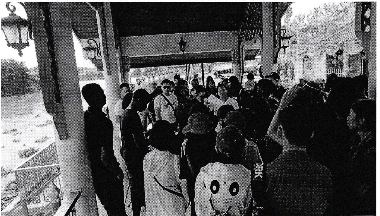
ทัศนศึกษาวัดพญูเชิง