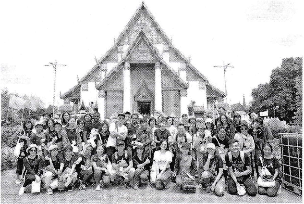
ทัศนศึกษาวัดมงคลบพิตร