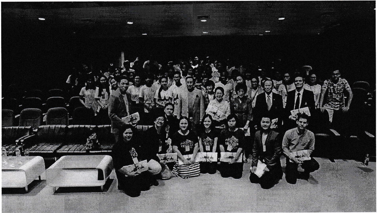
พิธีเปิดค่ายทีมมหาวิทยาลัยรังสิต