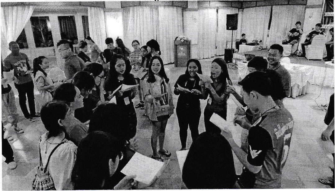
ธรรมารามวิหาร