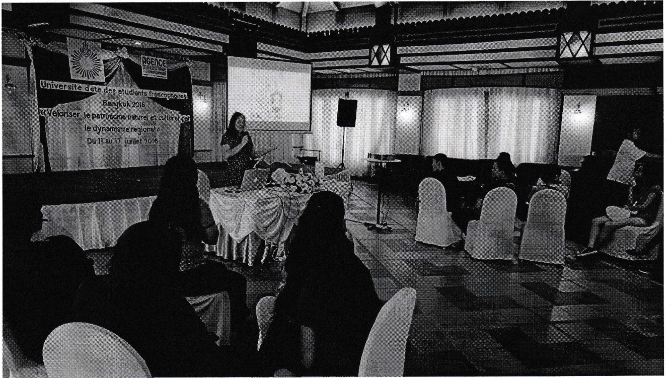
การบรรยายเป็นภาษาฝรั่งเศสเกี่ยวกับสถาปัตยกรรมไทย